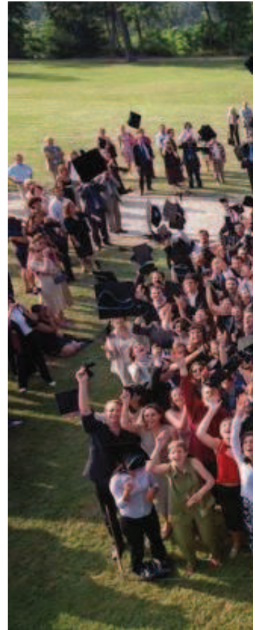
■ Des nouveaux diplômés d'HEC (École des

Il n'empêche, ces étudiants témoignent aussi de l'insertion de leur pays