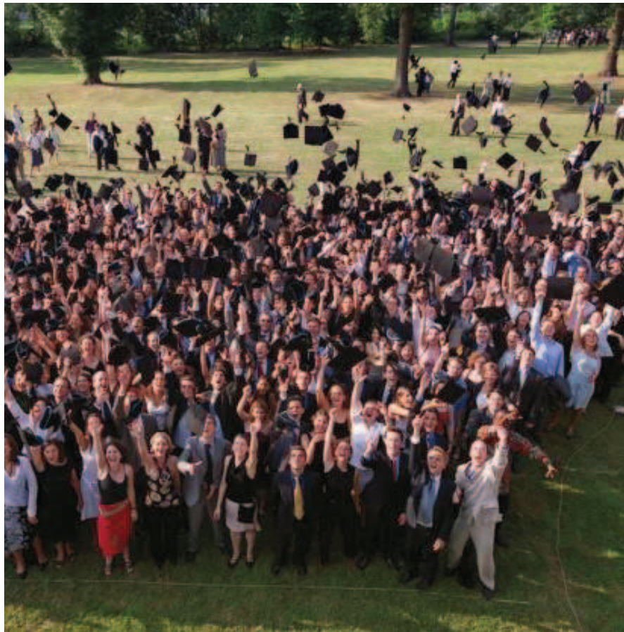
hautes études commerciales) expriment leur joie...